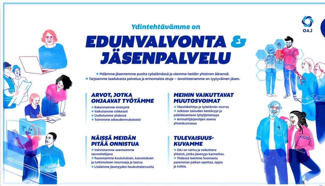
Kuva 1. OAJ:n strategia 2025–2028

Vuosikertomus noudattaa OAO:n vuodelle 2025 laadittua toimintasuunnitelman rakennetta. OAO:n toimintasuunnitelma 2025 painottui sopimusedunvalvontaan ja koulutuspoliittiseen vaikuttamiseen. Toiminnassa huomioitiin OAJ:n voimassa oleva strategia 2025–2028 (kuva 1).