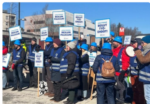
Lakkotunnelmaa Tampereella ja Helsingissä.